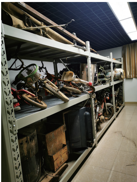
图一 大件藏品存放

地震纪念馆藏品档案囿于历史遗留问题和工作人员责任心、业务技能水平等因素,规范化不足。例如:部分藏品缺失征集凭证、捐赠凭证等,电子藏品清单中文物的来源信息也没有登记;藏品编目描述过于简单、笼统,仅有时间、用途、材质等信息;藏品定名不规范,随意性大,同一种藏品不同登记者定名方式不同、藏品命名不能体现藏品的详细特征;对于近现代文物资料来讲,原始背景资料同藏品本身一样重要,但当前仍存在原始资料缺失的情况,影响对藏品历史价值、教育价值和科学价值的判断。