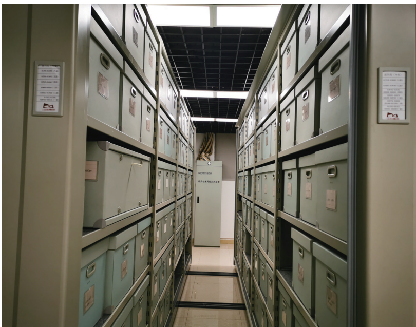
图二 有机质藏品存入无酸纸囊匣,柜架张贴号段